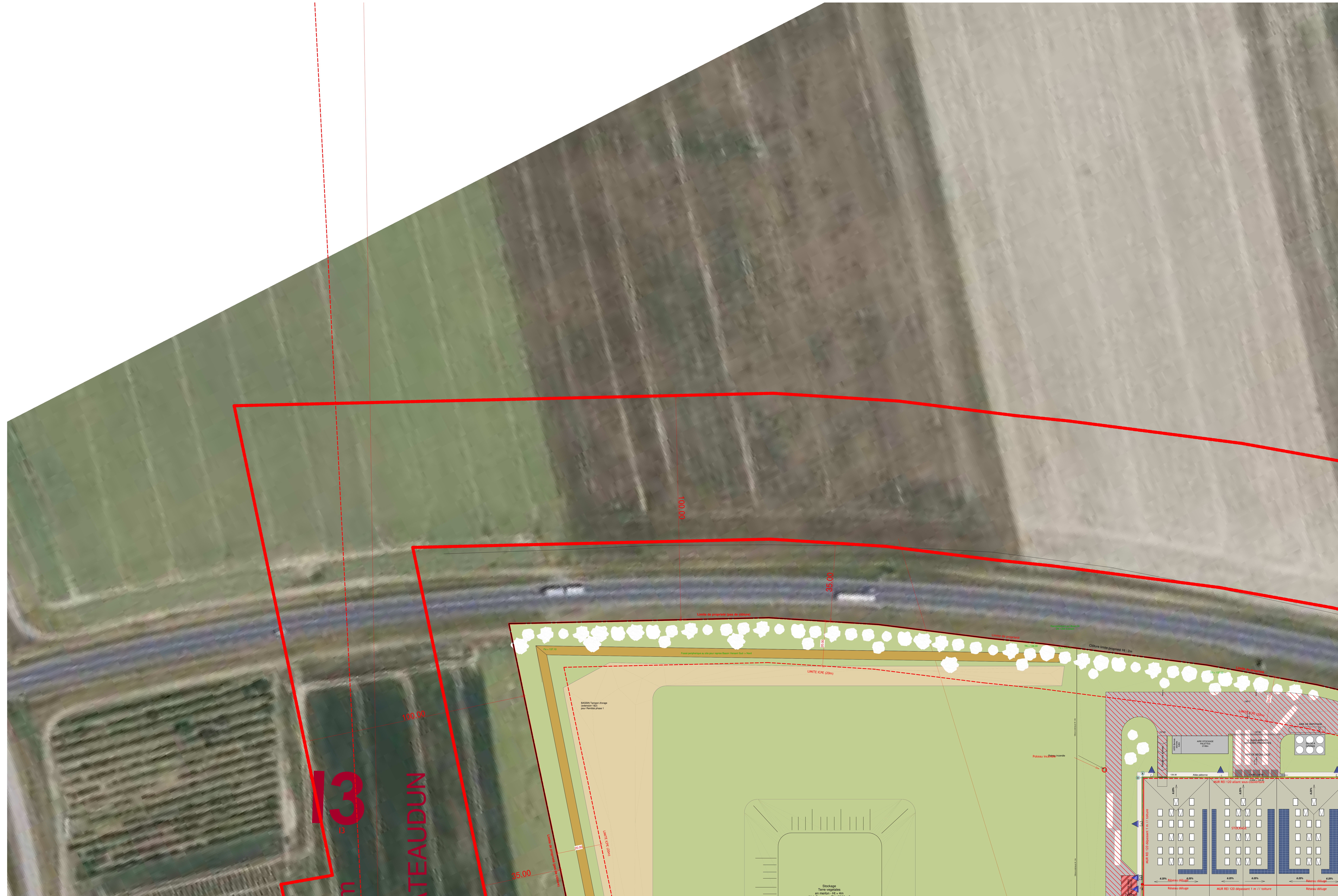
▲ ZONE A 1 : 500